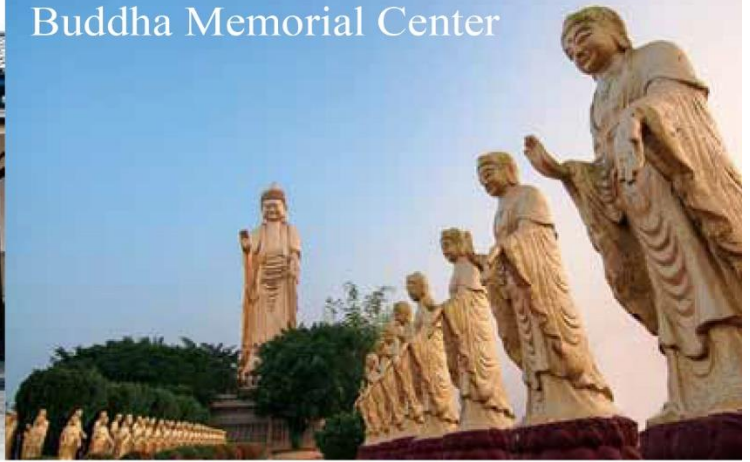
Buddha Memorial Center